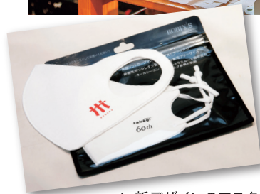
▲ 新デザインのマスク。