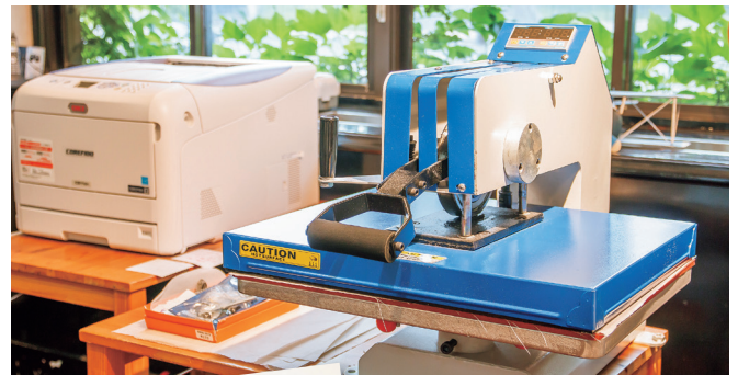
▲ トナープリンターと手動ヒートプレス機。

「循環型R-PET(ペットボトルリサイクル素材)」を使用し、軽量かつ折りたたみができるエコバッグを作成、推進しています。その活動により、北九州市より「エコプレミアム企業」として選定されました。また、環境保護に取り組んでいる企業からの注文も増え、今後もSDGs活動の一翼を担ってまいります。